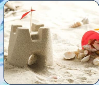
SMĖLIO PILIŲ ŠALIS